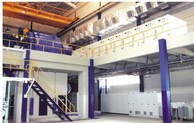
USINA CERRADINHO – Catanduva – SP: Sistema de ventilação e pressurização da casa de força.