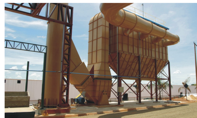
COPLANA – Jaboticabal – SP: Sistemas de despoeiramento beneficiamento de amendoim.