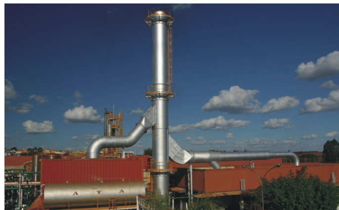
UNILEVER – Patos de Minas – SP: Sistema de exaustão das caldeiras a óleo.