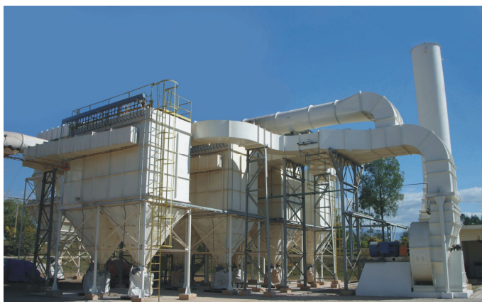
GRUPO SAINT- GOBAIN – Lorena – SP: Sistema de despoeiramento fornos eletrofusão de bauxita.