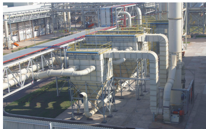
DURATEX – Itapetininga – SP: Sistemas de despoeiramento da fábrica de MDF.